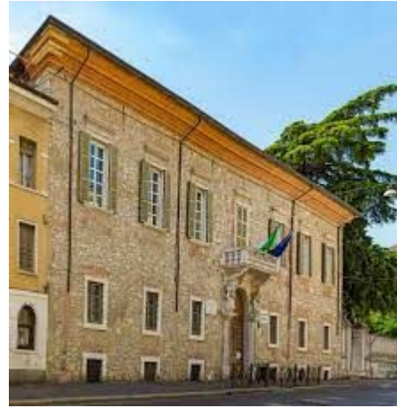
Università Cattolica, Milano