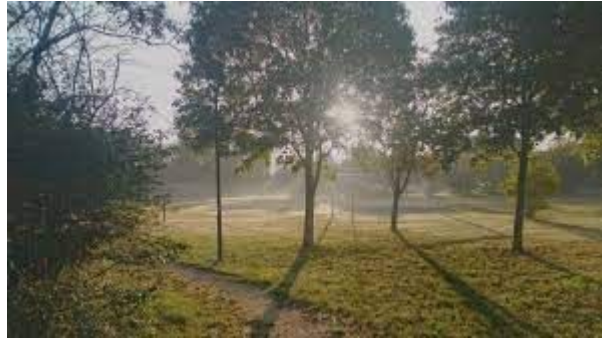
Parco cantarane, Borgosatollo